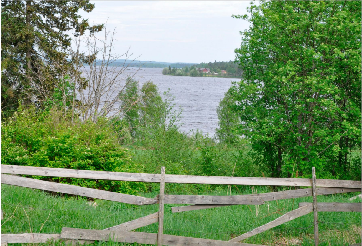
Yläsavolaisilla on onni asua hienoissa järvimaisemissa, joissa myös puhdasta pohjavettä riittää.