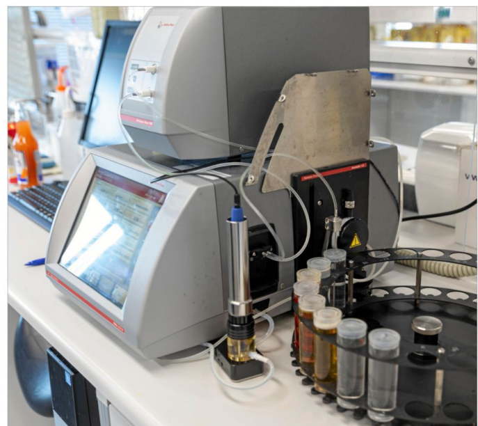
Puhtaus on puoli juomaa Olvilla. Panimotuotteiden laatuvaatimukset ovat korkeat ja laaduntarkkailu sen mukaista.

Lisäksi Ylä-Savon Vesi Oy on tehnyt Geologisen tutkimuskeskuksen kanssa pohjavesialueiden rakennetutkimuksia ja selvittänyt pohjavesien virtauksia ja mahdollisia uusia kaivonpaikkoja.